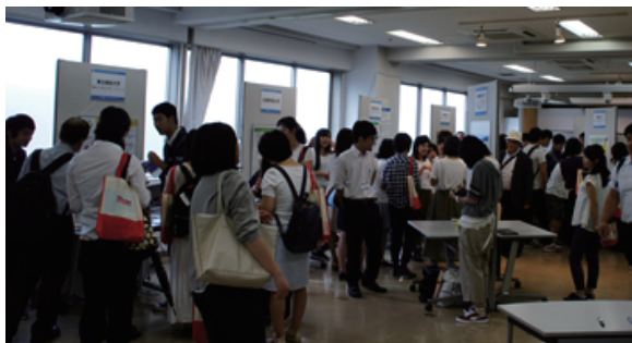
図1 実践事例コンテスト2016会場の様子

り、投票の際に参加者がコメントを記入できるようにしたりと、より多角的な視点で各取り組みを評価し、参加者間の交流が促されるよう工夫を重ねてきた。今回もそうした試みが功を奏し、会場内は熱心に説明する学生や積極的に質問する参加者の熱気に溢れていた（図1）。