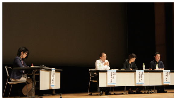
図3 パネルディスカッションに登壇した講師の様子

教職員・学生共通企画では、障害者雇用の専門家及び企業で活躍する聴覚障害当事者を講師に招き、障害者雇用促進法改正の趣旨について学ぶとともに、就労に向けたキャリア発達支援のあり方や学生が身に付けておくべき力についての講演を行った。法改正という時宜に合ったテーマであったと同時に、支援方法のみに限定せず聴覚障害学生本人が何をすべきかという点も一つのテーマに掲げたレクチャーで、教職員も学生もそれぞれの立場で学びの多い講演会となった。