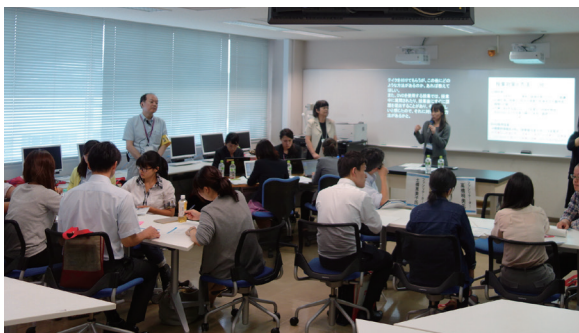
図2 事例討論会の様子

事例討論会は本シンポジウムで初めて取り入れた企画の一つで、参加者同士でより具体的な意見交換を深めたいとのニーズを受けて取り入れることとなった。企画段階においては、PEPNet-Japan 連携大学・機関関係者の中でも特に聴覚障害学生支援について幅広い実践経験を有し、少人数討論のファシリテート経験が豊富な方々に講師を依頼し、また取り扱う事例については、参加申込者に対し事前に事例提供を募り、寄せられた事例をもとに具体的課題についての討論が行えるようにした。当日は、参加した人数や属性に応じ各ファシリテーターが柔軟に討論を誘導し、後述する通り参加者の満足度は非常に高い結果となった。特に、教職員・学生の枠を超えてともに議論ができる点や、聴覚障害学生の支援に造詣の深いファシリテーターの存在等、PEPNet-Japanの特長を活かせる企画として今後発展させられる手応えが得られた（図2）。