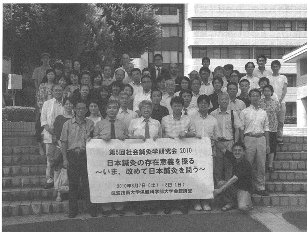
2010年8月8日(日)：参加者集合写真