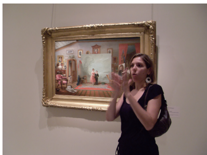
図1 ろう者ガイドの手話による作品解説

ラリートークでガイドを務める鑑賞プログラム「Art Signs: Gallery Talks in American Sign Language」を提供している(図1)。第一言語であるアメリカ手話を通して、ガイドと参加者との間で鑑賞において積極的な意見交換や会話のやり取りが可能となっている。同時にろう者ガイドの手話による案内・作品解説のもとで、音声通訳をつけることにより、ろう者・聴者ともに楽しめる場も提供している。また、スミソニアン・アメリカ美術館の公式HPやYouTubeに「Art Signs Online Video Series」といった手話によるスミソニアン・アメリカ美術館収蔵作品の解説映像が複数制作・掲載されている(図2)。ろう者が自ら手話で解説し、また英語の字幕も付与されているため、手話使用者や手話を理解しない人も容易にアクセスできるよう配慮されている[4]。