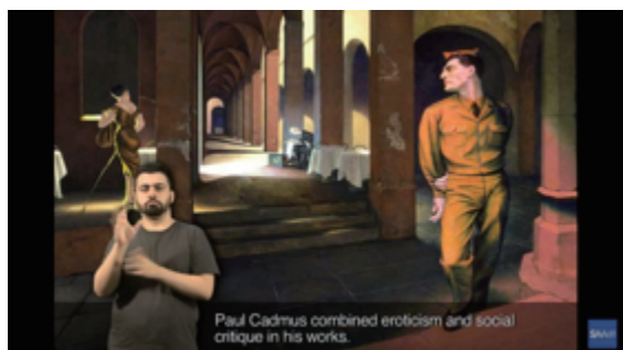
図2 「Art Signs Online Video Series」の画面