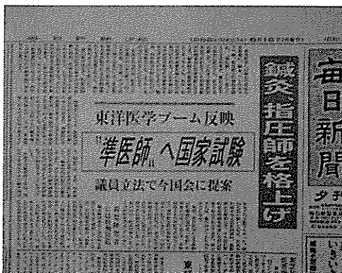
図1「準医師」が目を引く新聞トップ記事

余程のことがない限り、鍼灸関連の記事がマスコミのトップになることはない。1988(昭和63)年5月16日付、毎日新聞(夕刊)(図1)の一面をここに挙げる。東洋医学のブーム、鍼灸師を”準医師”に格上げ、飛躍的な需要の増加、質の高い鍼灸師などといった記事内容に心躍らせ、将来への期待を大きくしたものが多かったはずだ。丁度、鍼灸専門学校で学んでいた筆者もその一人だった。戦後四十年間、地位向上を求めてきた鍼灸師団体の念願でもあった、とも書いてある。いわゆる、あはき法(法律217号)の大改正から27年、本稿では、忘れてはならない社会鍼灸学的重要史実の記録と検証を主眼として、本研究会での過去のディスカッションを踏まえ、日本社会における鍼灸の立ち位置について革めて考察する。