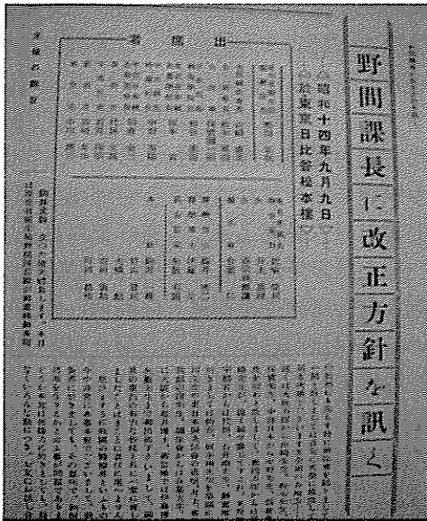
図3 東邦醫學 あまり知られていなかった事実